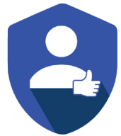
Easy to use