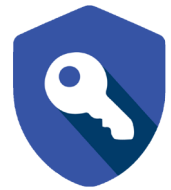
Gestión de Llaves

La gestión de llaves está sujeta al control digital, ejerciendo en todo momento el control exacto de quién tiene cada llave. Los armarios de custodia de llaves se gestionan a través del software KeyWin5 que registra todos los eventos.