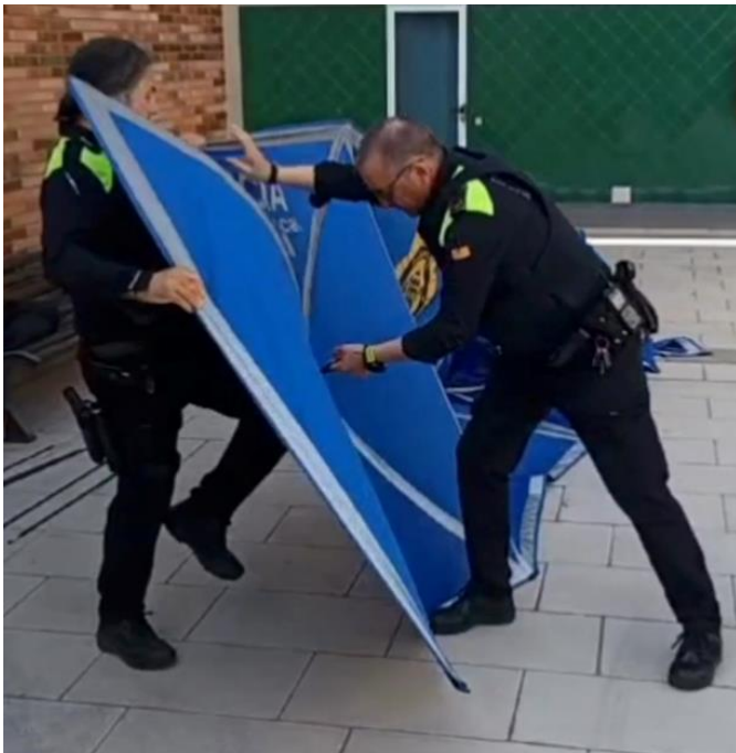
Una persona se encargará de tirar hacia el mismo unas tiras negras, mientras la otra persona que se encuentra detrás de la mampara ayudará con la rodilla para su despliegue en forma de paraguas.