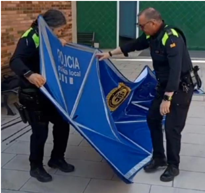
Se despliega totalmente la MAMPARA DE EMERGENCIA